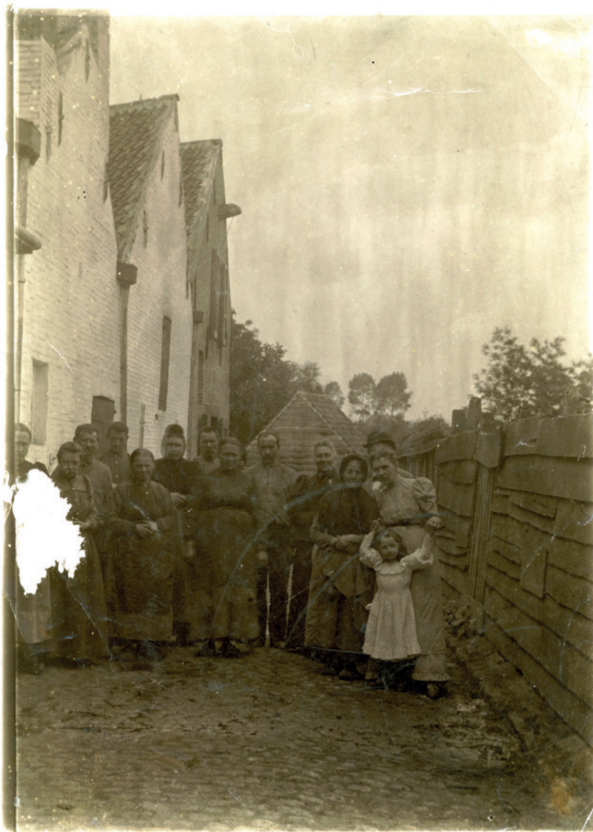
Het personeel van de fabriek Buysse-Loveling rond de eeuwwisseling.